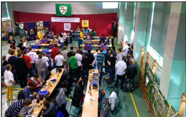
Foto: Polsko – Rybnik Open 2014 (120 účastníků)